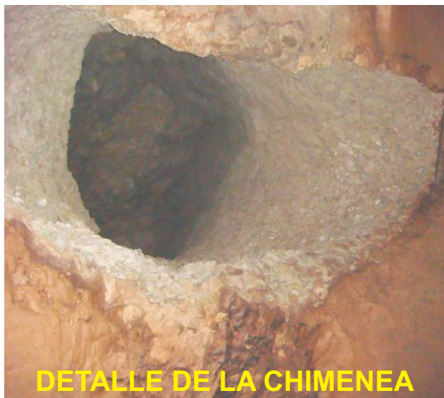
DETALLE DE LA CHIMENEA