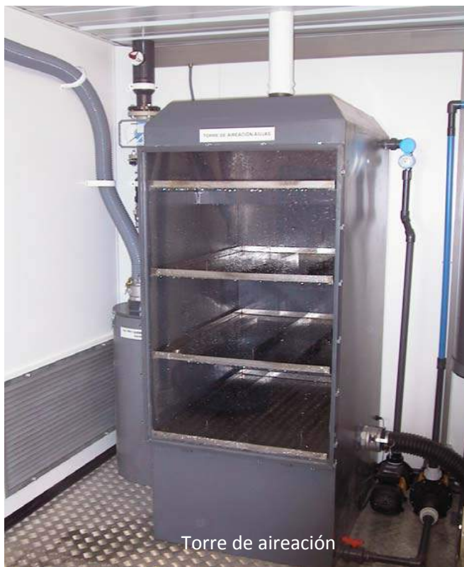
Torre de aireación