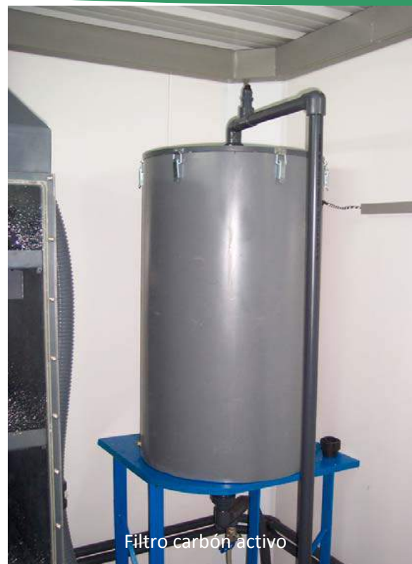
Filtro carbón activo