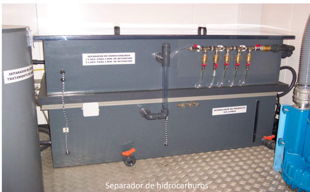
Separador de hidrocarburos