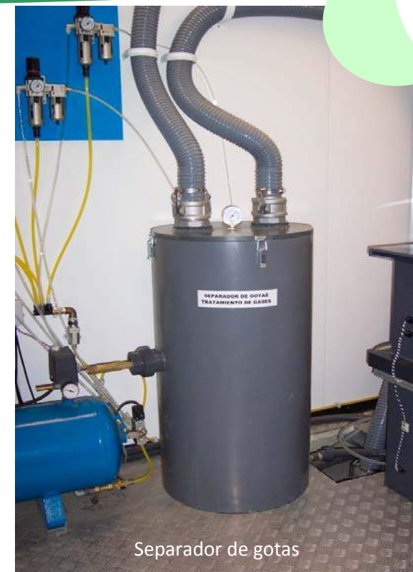
Separador de gotas