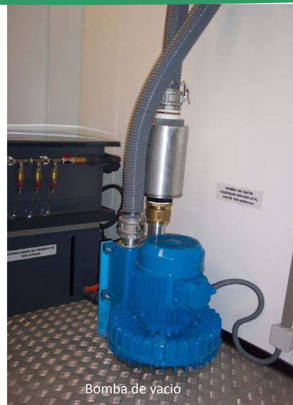
Bomba de vacío