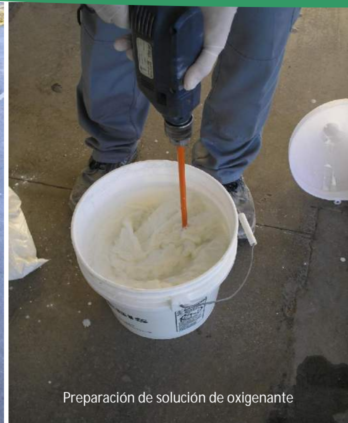
Preparación de solución de oxigenante