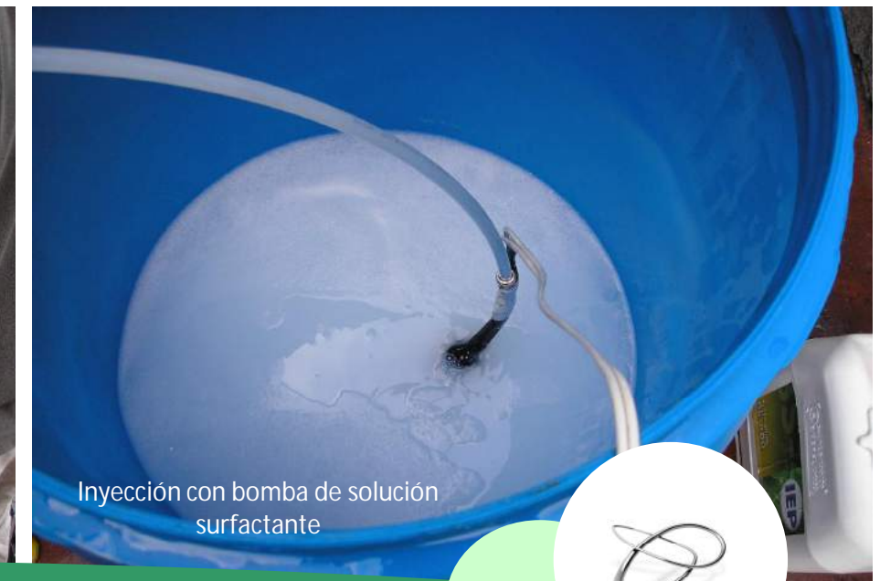
Inyección con bomba de solución surfactante