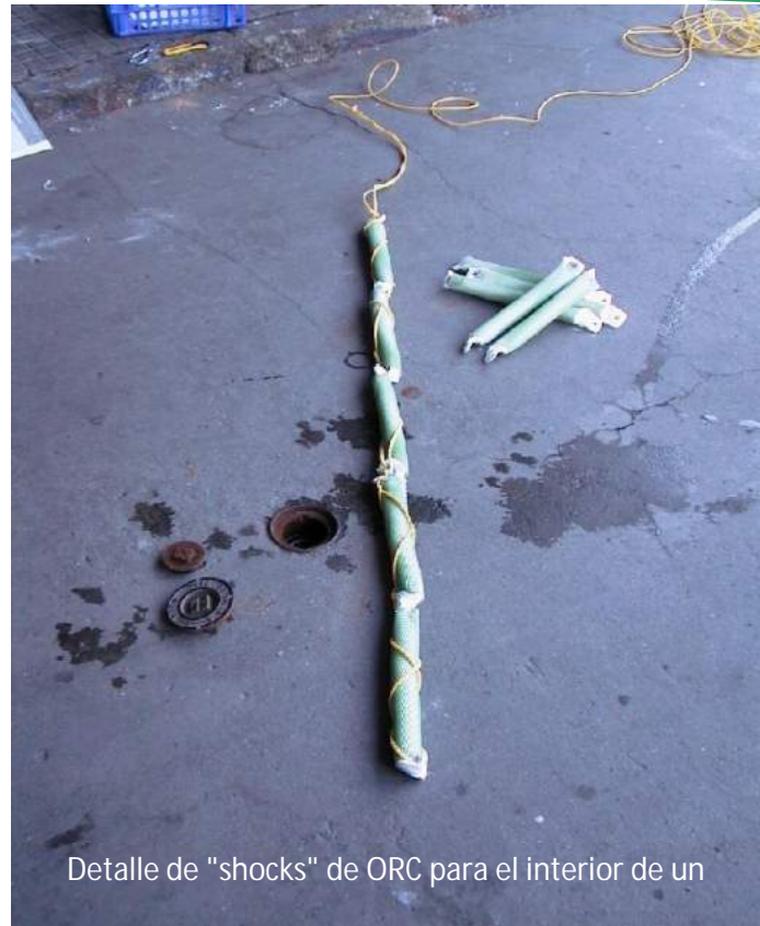
Detalle de "shocks" de ORC para el interior de un