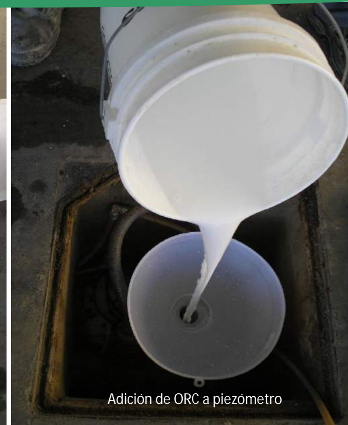
Adición de ORC a piezómetro