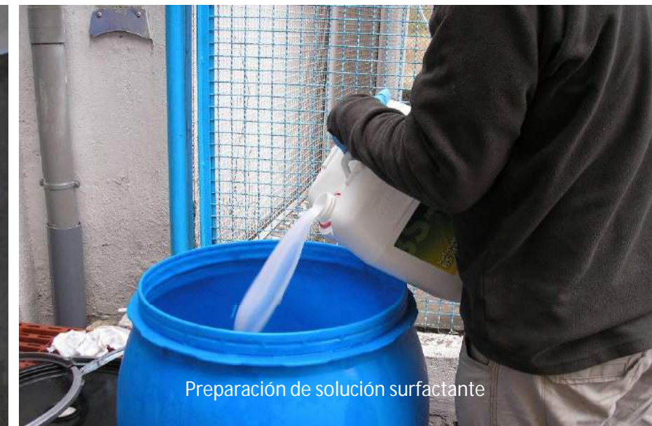
Preparación de solución surfactante