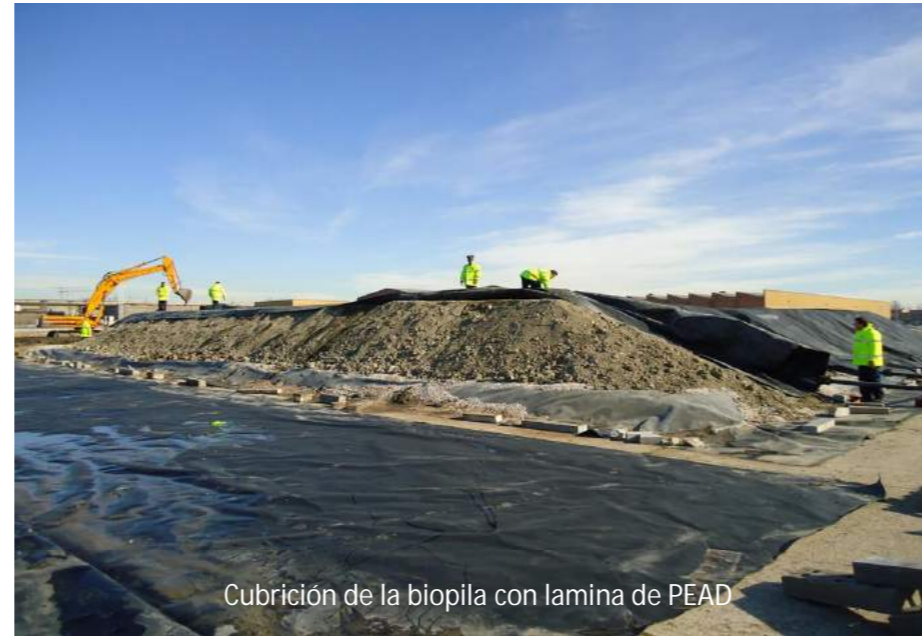
Cubrición de la biopila con lamina de PEAD