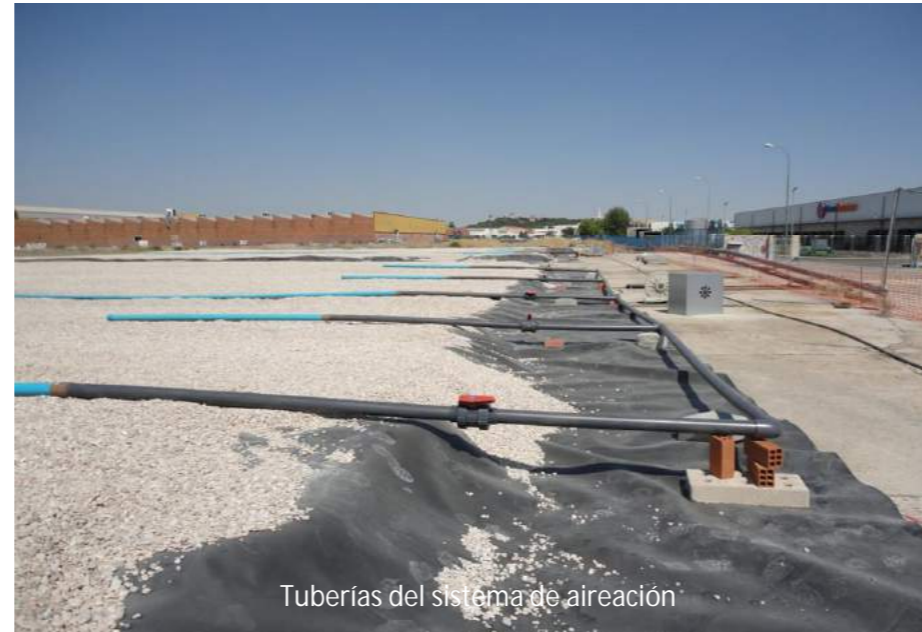
Tuberías del sistema de aireación