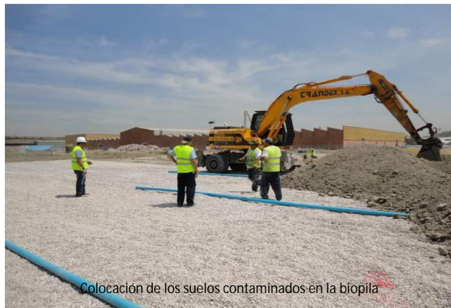
Colocación de los suelos contaminados en la biopila