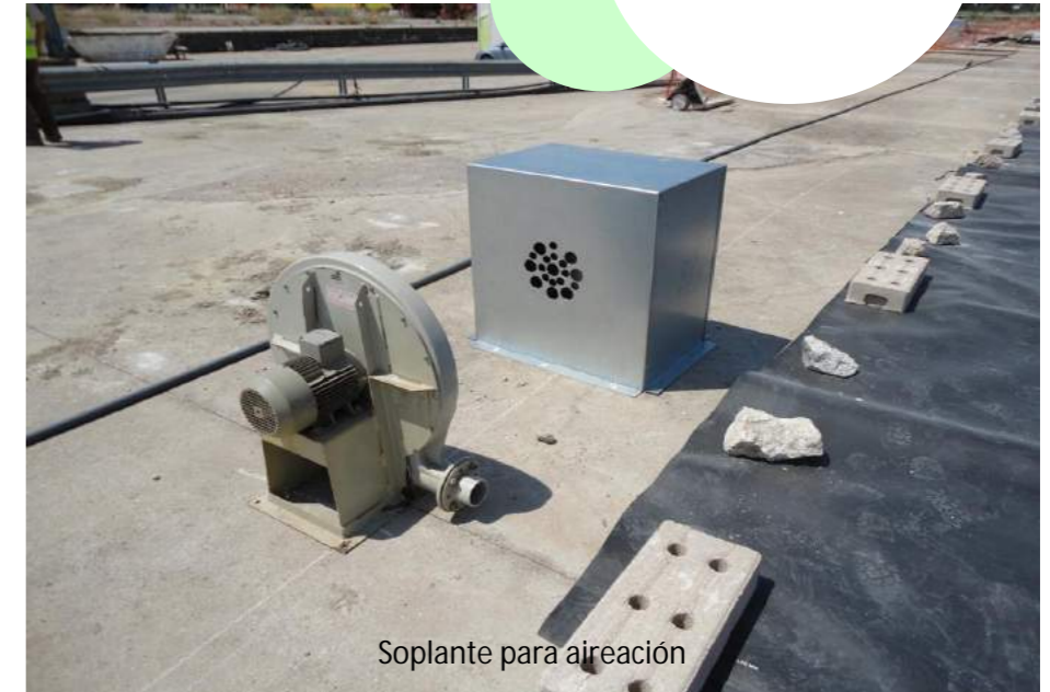
Soplante para aireación